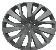
capace 16" TONGARIRO