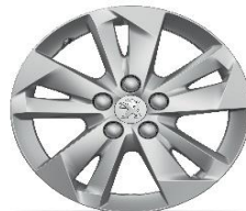
jante aliaj 16" TARANAKI