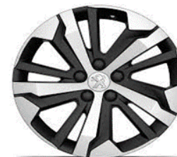
jante aliaj 17" AORAKI