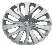
capace 16" RAKYURA