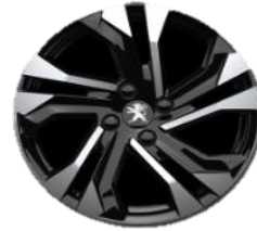
Jante aliaj diamantate 17"