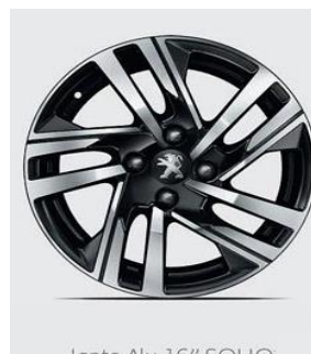
Jante Alu 16" SOHO