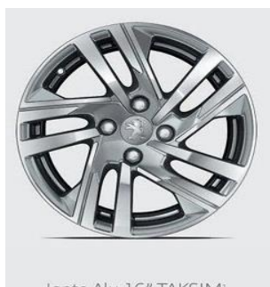
Jante Alu 16" TAKSIM