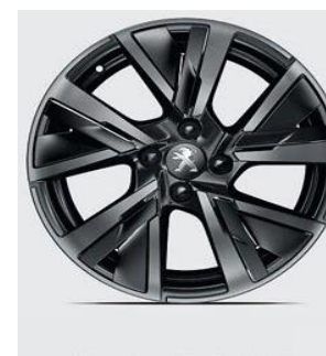
Jante Alu 17" BRONX