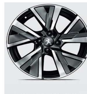
Jante Alu 17" CAMDEN