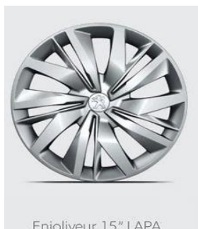
Enjoliveur 15" LAPA