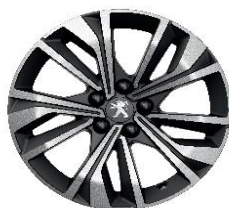
17'' MERION Diamantee