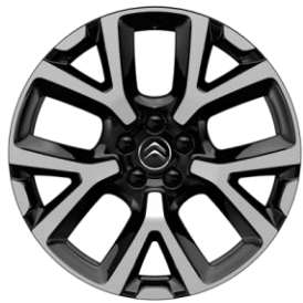
Jante aliaj diamantate 19" ART (Tall & Narrow) (205/55 R19) (ZHY8)