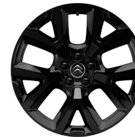
Jante aliaj Full Black 19" ART (Tall & Narrow) (205/55 R19) (ZHY9)