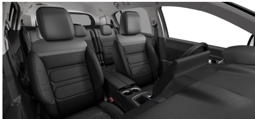
Tapiterie mixtă Metropolitan Black (TKFF)