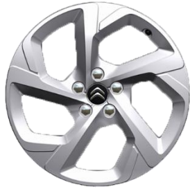
Jante aliaj 18" SWIRL (Gris Eclat Brillant) (225/55 R18) (ZHC7)