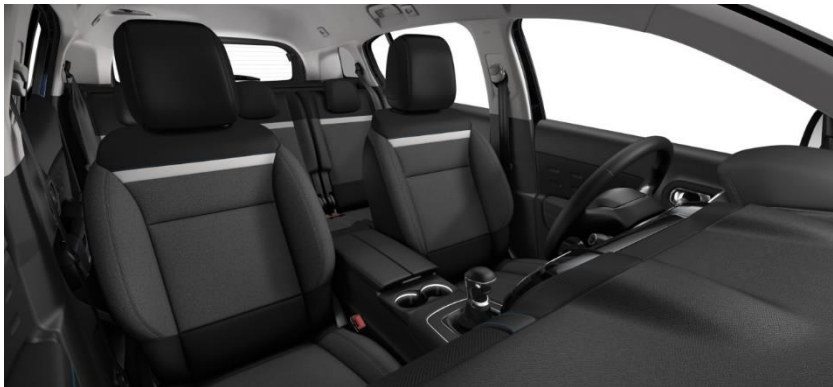
Tapiterie textilă Silica Grey (51FR)