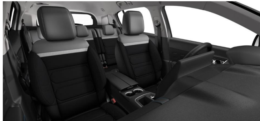
Tapiterie mixtă Wild Black (V4FC)