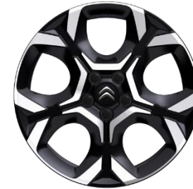
Jante aliaj diamantate 18" PULSAR (225/55 R18) (ZHXI)