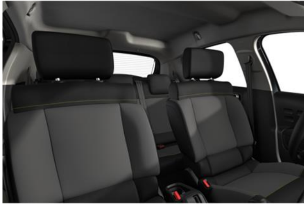
Tapiterie textila Mica Grey (23FR)