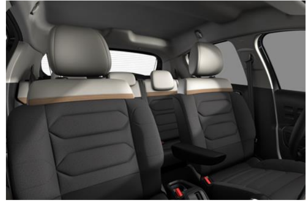
Tapiterie mixta material textil / TEP Techwood (V0FC)