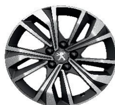
17'' MERION Diamantee