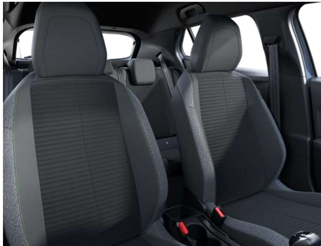
Tapițerie PNEUMA cu țesătură în relief 3D, material Leorki chine și cusături de culoare verde