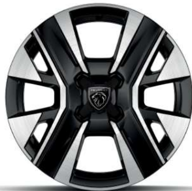
Jante aliaj de 16" „diamond cut”