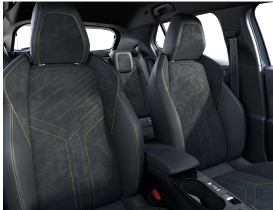
Tapițerie Mistral ICONIUM Alcantara® cu material TEP Isabella, piele Alcantara neagră și cusături Adamite Verde