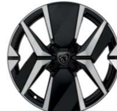
Jante aliaj de 17" „diamond cut”