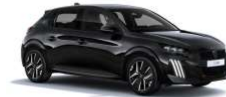
Negru „Perla Nera”