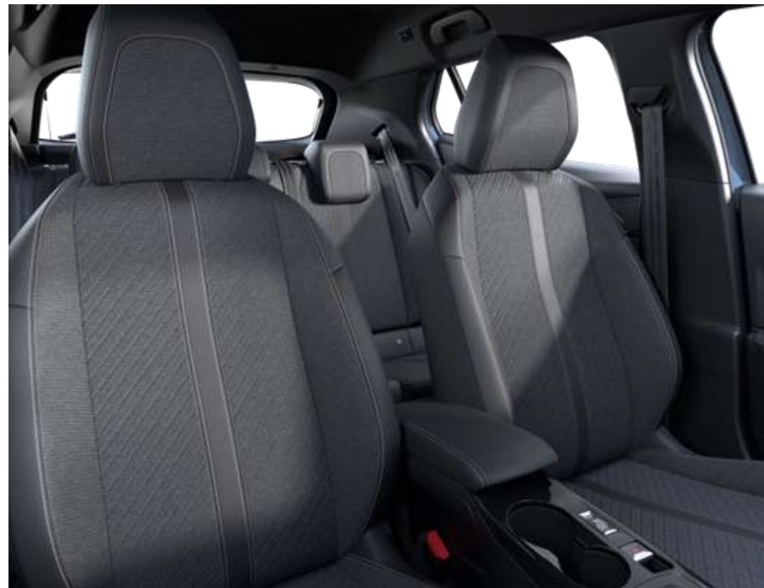
Tapițerie CASUAL LOMSA cu țesătură în relief, material TEP Isabella, material LOMSA și cusături Quartz