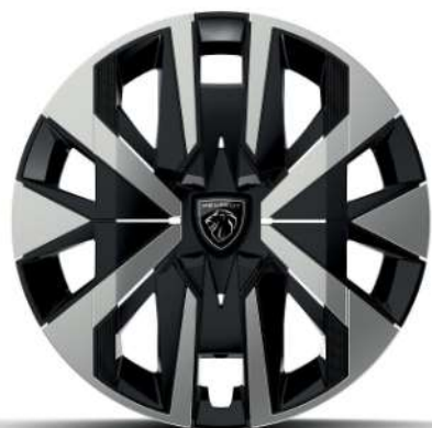
Jante oțel de 16"