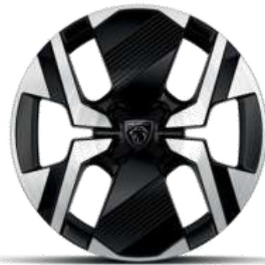
Jante diamantate bi-ton KARAKOY din aliaj de 17"

Standard pe nivelele de echipare ALLURE și GT