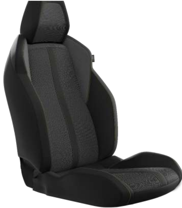
Tapițerie din țesătură BELOMKA, cu TEP Isabella, tapițerie Uni Copy și cusături Adamite Green