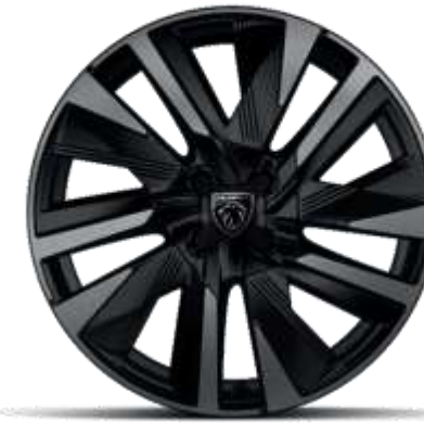
Jante diamantate bi-ton EVISSA din aliaj de 18"

Standard pe nivelele de echipare ALLURE și GT