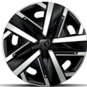
Jante de oțel SILOM de 16"