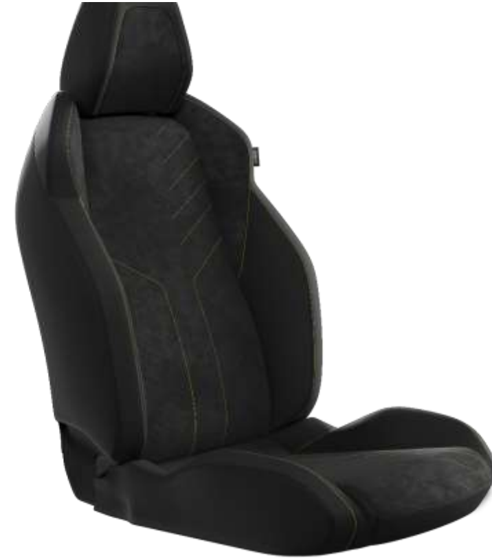
Tapițerie Mistral ICONIUM Alcantara® cu tapițerie TEP Isabella, Alcantara neagră și cusături Adamite Green